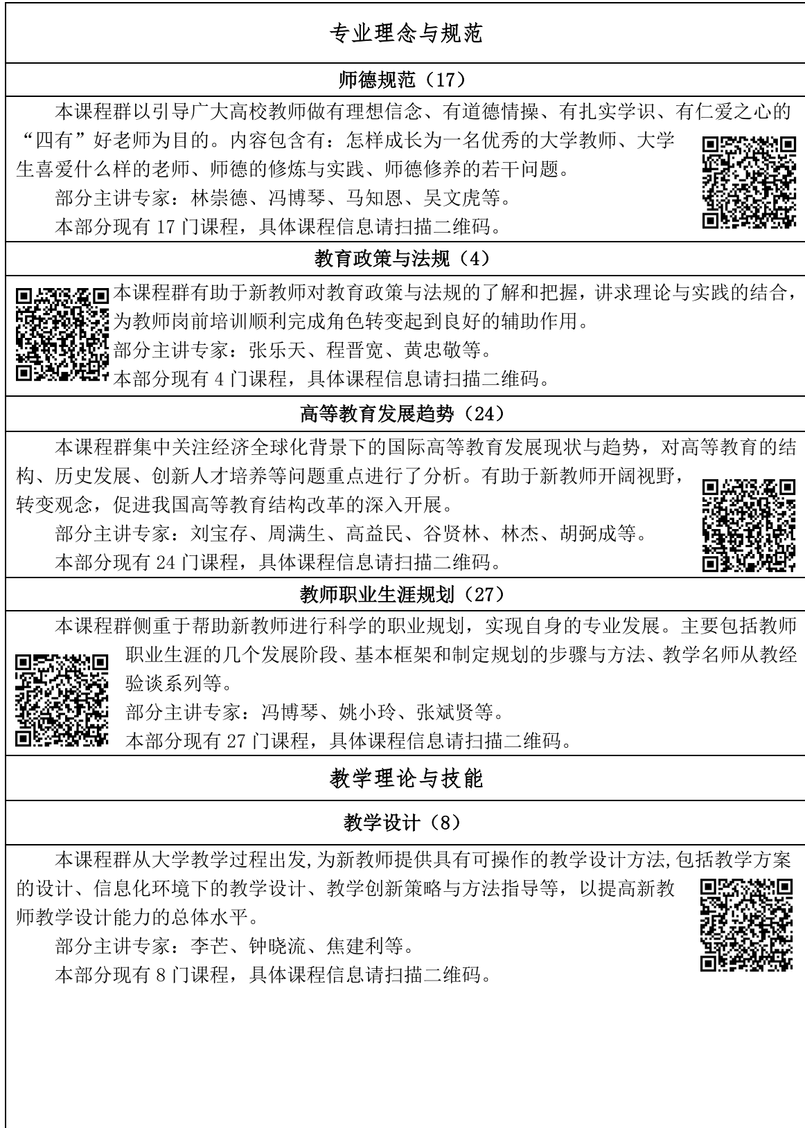
表 1 新教师在线点播培训课程